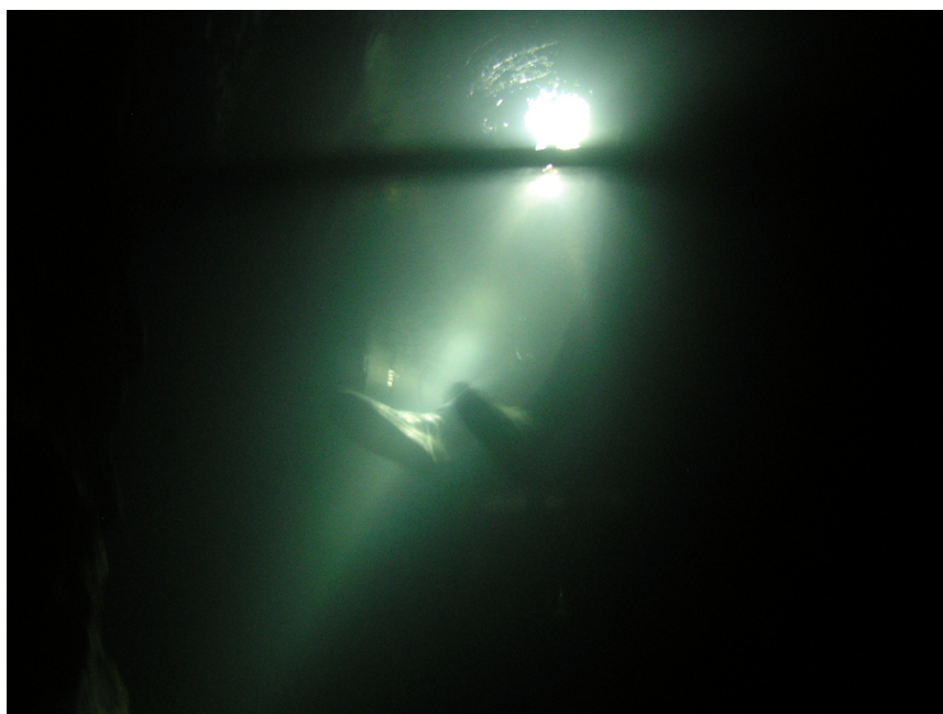
Vue de Michael depuis le dessous de la cloche